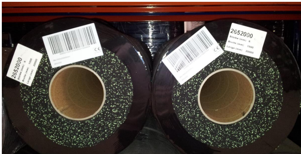
Obr. 4: Věnujte pozornost číslům šarže uvedeným na štítku