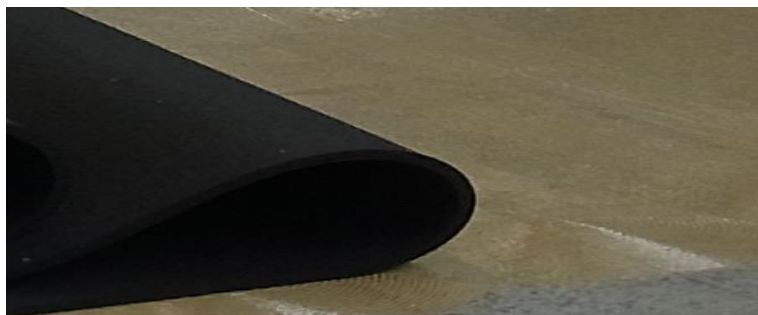
Obr. 2: Instalace podlahy SPORTEC®