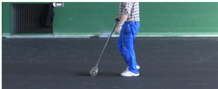
Obr. 3: Přitlačení podlahy SPORTEC® k podkladu