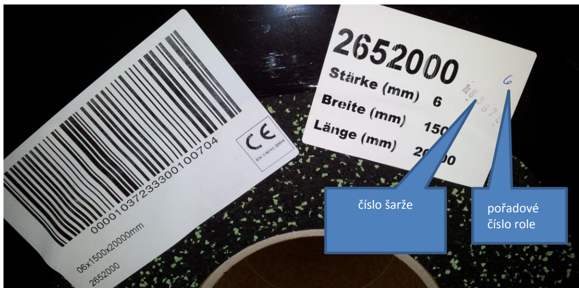
Obr. 5: Označení rolí a šarže

V případě špatné dodávky - poškozené zboží, nesprávné množství apod. oznamte pochybení okamžitě a zastavte pokládku. Nárok na výměnu zboží máte pouze v případě, že zboží není použité a udáte číslo šarže obr.5.