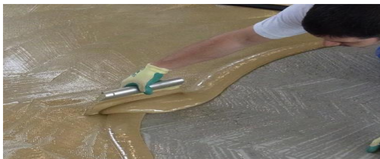
Obr. 1: Lepidlo nanášejte na suchý a rovný podklad

Při aplikaci speciálního dvousložkového PU lepidla se řiďte pokyny od výrobců materiálů. Lepidla pro lepení podlahy SPORTEC®color aplikujte pouze na suchou a čistou podlahu. Po instalaci nevstupujte na podlahu, dokud lepidlo úplně nezaschne. Stejným způsobem postupujte v případě povrchové úpravy. Před aplikací nátěru zkontrolujte, že je podlaha čistá. Pokud je to nutné, před aplikací ji vysajte. Nevstupujte na podlahu, dokud nátěr zcela nezaschne.